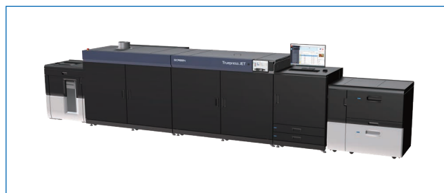
Truepress JET S320

SCREEN GAは今回の製品化により、当社ワークフローシステム「EQUIOS」とのワークフローソリューションの充実、CTP・オフセット印刷によるハイブリッド印刷、そして「Truepress JET 520シリーズ」との併用活用による生産性向上など、さまざまなソリューションを展開していきます。