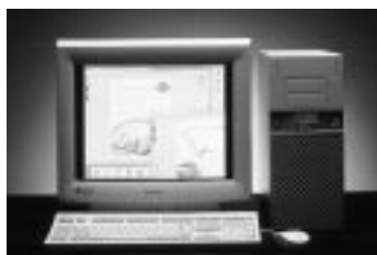
レナトスVer.6.1 大河パッケージ