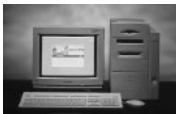
FlashRIP-AD for Macintosh