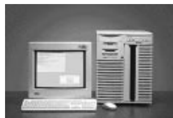
FlashRIP-HQ Ver.5.0 for Windows