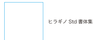
ヒラギノ Std 書体集