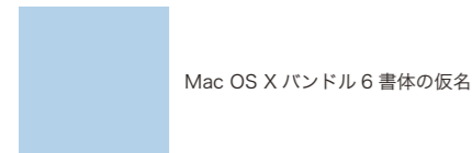
Mac OS X バンドル 6 書体の仮名