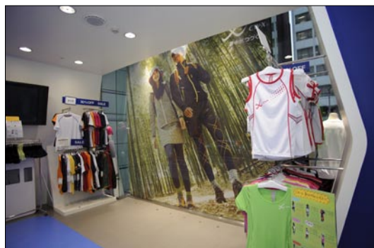
夕方・ストア内から