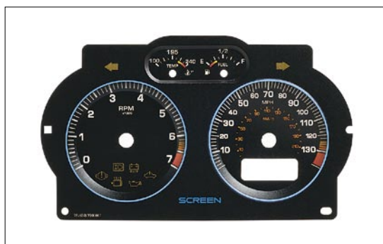
印刷サンプル (メーターパネル)