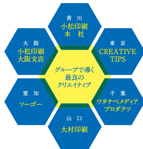
各拠点内だけでなく、全国のネットワークを駆使したチーム編成で、最良のカタチを導き出します。

刷物を提供している。さらに、企画編集・デザインなど印刷の上流工程にも力を入れ、既にグループ全体で総勢300人規模の制作スタッフを擁するまでに成長している。