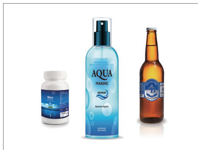
アプリケーション例