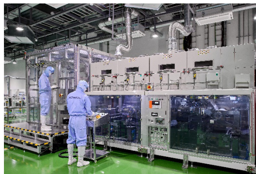
水電解用 CCM の量産設備

東京ガスと SCREEN は、2021 年 5 月より、東京ガスが燃料電池開発で培った触媒技術および評価技術と SCREEN が保有するロール to ロール方式による連続生産技術を融合した水電解用 CCM の共同開発に取り組んできました *3 。2025 年 2 月には、SCREEN が、自社彦根事業所の敷地内に水素関連事業の部材製造スペース等を備えた新棟（以下「本工場」）が竣工 *4 し、経済産業省「GX サプライチェーン構築支援事業 *5 」および国立研究開発法人新エネルギー・産業技術総合開発機構（NEDO）の支援 *6 のもと、本工場内に水電解用 CCM の量産設備の導入を進めてきました。このたびの量産受注体制の確立により、国内外からの需要に応じて、最大電極面積 5,000 cm 2 の大面積水電解用 CCM を国内最大規模となる年産 2 GW 相当の生産能力で安定的に供給することが可能となります。