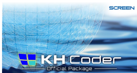
KH Coder オフィシャルパッケージ

株式会社SCREENアドバンスシステムソリューションズはこのほど、人の言葉として表現されたテキストデータを可視化・分析するテキストマイニング・ツール「KH Coder オフィシャルパッケージ」を発売。本日12月20日から提供を開始します。