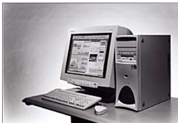
ハイパフォーマンス型PC「WD-733iNTH」に 搭載された「AVANAS MultiStudio Office」 この画像の印刷用データ(解像度300dpi)は、下記URLよりダウンロードできます。 ( http://www.screen.co.jp/press/photo.html )