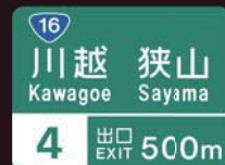
▲参考：従来の高速道路標識