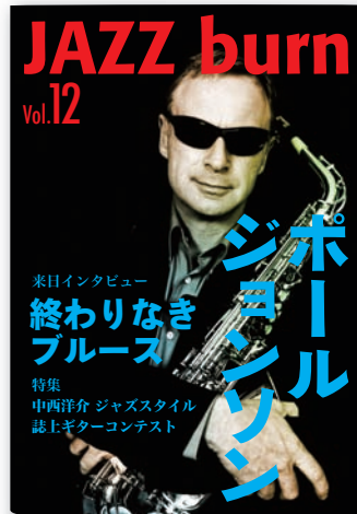
使用例：雑誌の表紙や書籍の装丁など

ヒラギノ角ゴ オールドは、W6からW9の4種類のウェイトで構成されています。小説や情報誌の見出しなど、さまざまな表現で誌面を演出します。