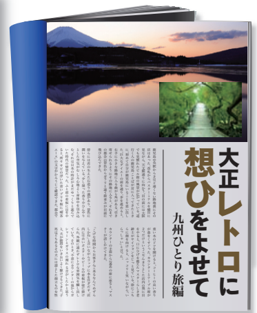
使用例：記事の見出し