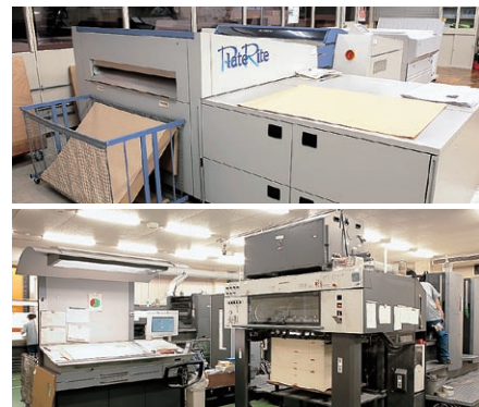
本社・青梅工場に設置されたCTPシステムや印刷機

伝統の技と最先端の機器・システムを高い次元で融合させる精興社は、さらなる可能性に向かってたくましくチャレンジする。