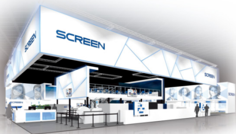
当社ブースのイメージ図

株式会社SCREENグラフィックアンドプレジジョンソリューションズは、2016年5月31日（火）から6月10日（金）までドイツ・デュッセルドルフで開催される世界最大の国際総合印刷機材展「drupa 2016」に「Achieve the Extraordinary in Print」をテーマに出展。当社ブース（Hall 8a・stand C11）において、当社の技術開発コンセプト「SCREEN GPI3」を軸に、これまでの印刷に対する既成概念を変えてゆく最新のソリューションを提案します。