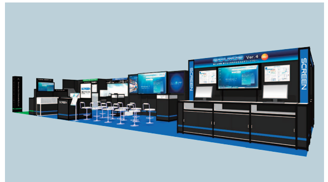
当社ブース ブースNo.C-17

国内シェアNo.1のTrueflowの機能と信頼性を、さらに進化させた商業印刷ワークフローソリューション「EQUIOS」の新バージョン「Ver.4」を国内初出展。最新のAdobe PDF Print Engine 3に対応。待望の大貼り機能も搭載し、ワークフローの自動化を一気に加速させます。ミス・ロス削減できる「EQUIOS Inspection」による検版ソリューションやクライアントとのコミュニケーションを密にする「EQUIOS Online」など、最新バージョンもご紹介します。プレゼンテーションでは、従来の受注型印刷ビジネスからマーケットリーダーへと生まれ変わるために求められる営業、現場、人材の改革に、EQUIOSを中心としたワークフローがどのようにして貢献できるのかを分かりやすく具体的に解説。最新のEQUIOSの特長を詳しく紹介する「よくわかるEQUIOS講座」も実施します。さらに、インクジェットでのブルーソリューションやクライアントへの新提案、印刷ビジネスの新発想を満載したデジタル印刷、超高品質CTPによる多彩なサンプルなどを展示します。