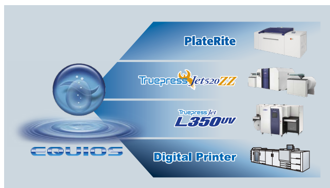
ユニバーサルワークフロー「EQUIOS」